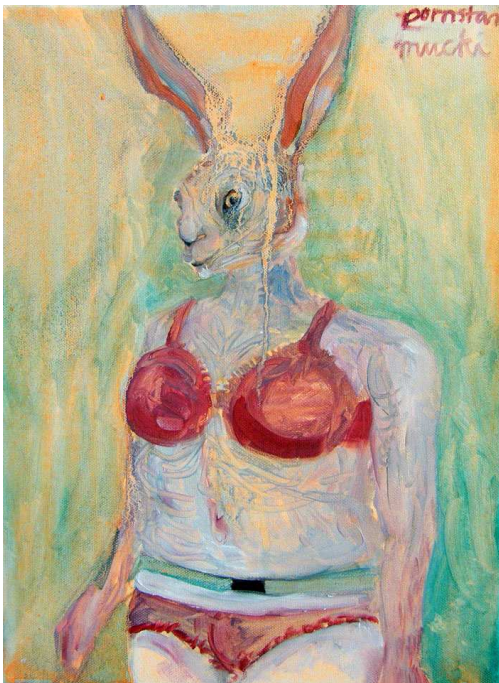
« Pornstar Mucki », oil on canvas, 40x20cm.