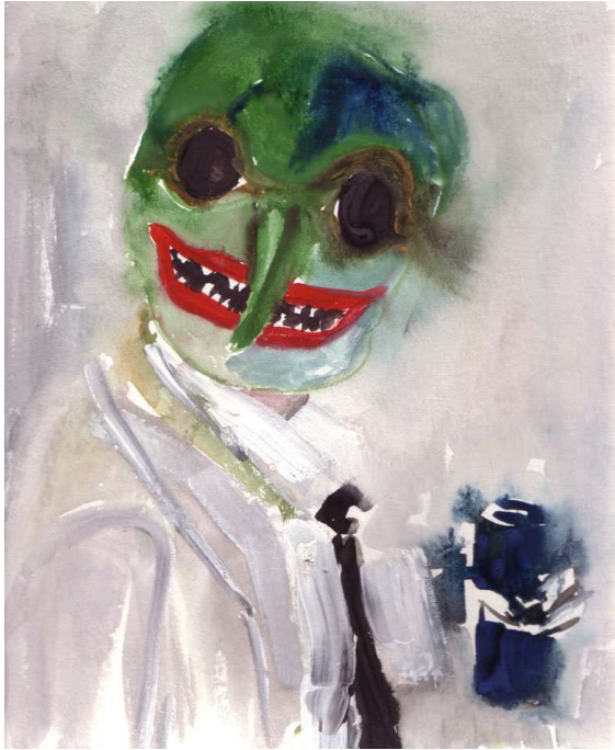
« Happy Beer », oil on paper, 25x25cm. 2010.