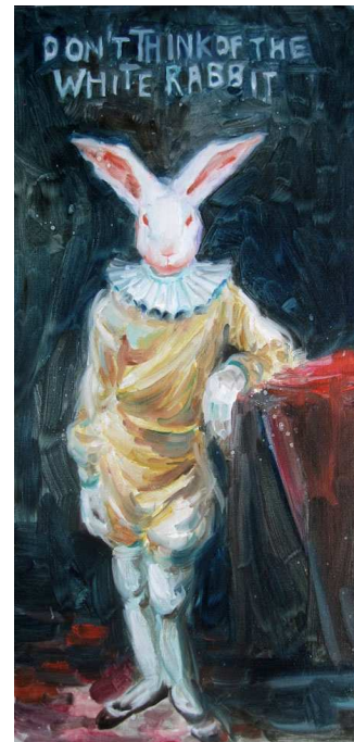
« Don't think of the white rabbit », oil on canvas, 60x30cm. 2011.