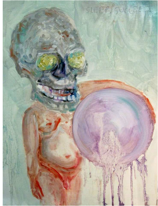
« Sleep Succeed », oil on paper, 40x30cm. 2011.